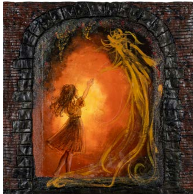
IO SONO LUCE RACHELE BENEDETTI