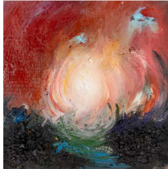
PULSAZIONE LI DEYANG