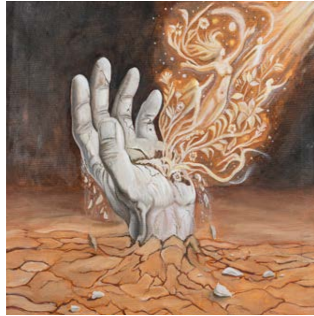
RISVEGLIO DI LUCE NEL GREMBO DI PIETRA JACOPO DI DOMENICO