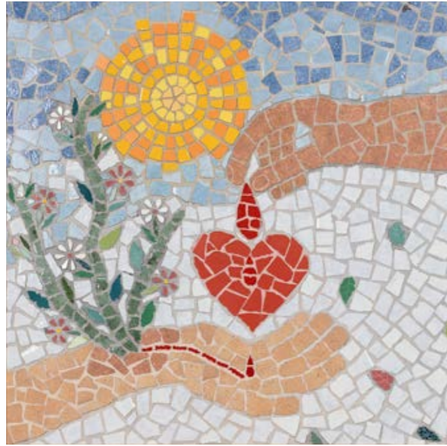
DAL CUORE ALLA LUCE GIOVANNI CAPORALE