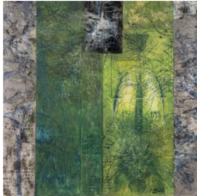
SOGLIA COSIMO ERMINI