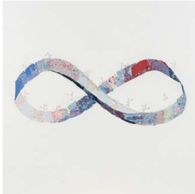
LEGAME CHENG SANSHAN