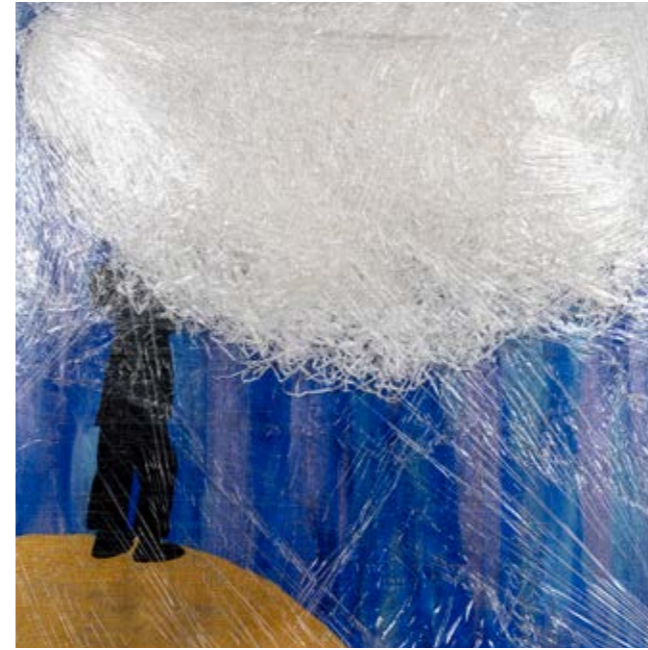
REBIRTH UNDER A CLOUD OF COLORS SABRINA LELLI